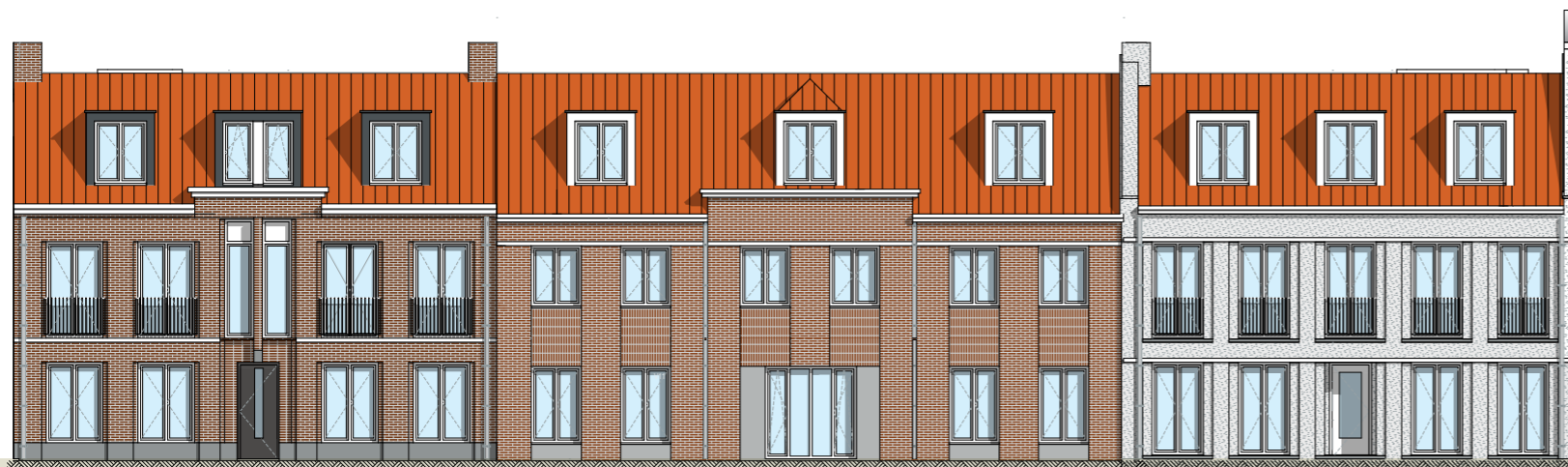
VOORGEVEL LANGE WOLSTRAAT